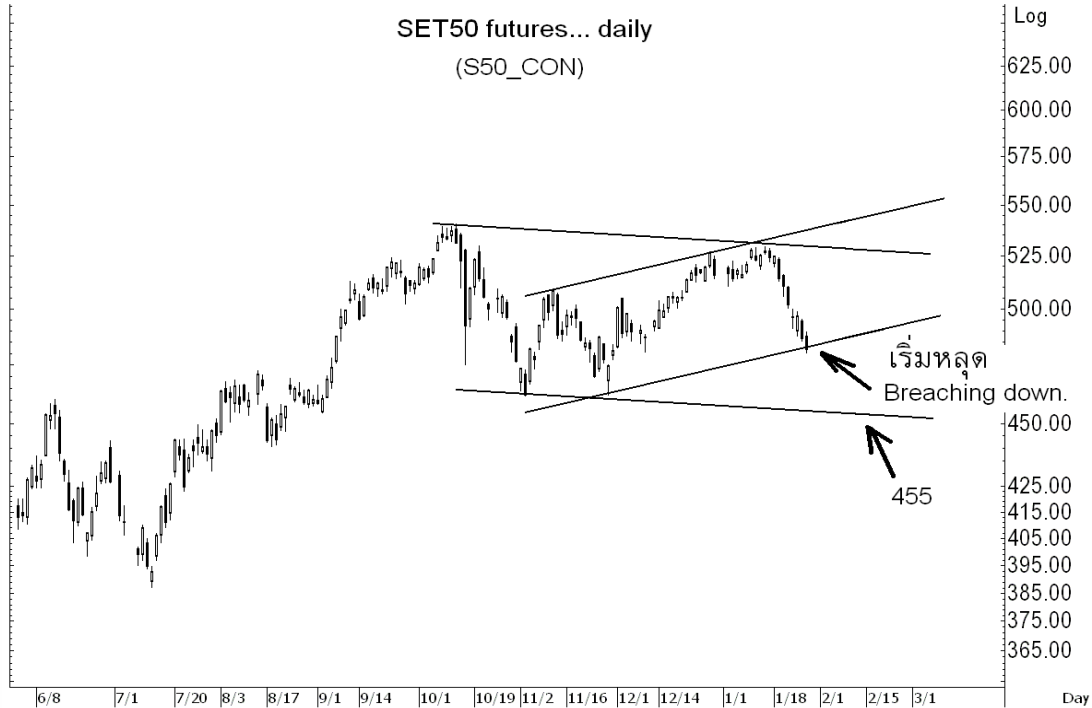
Figure 1: Technical Analysis