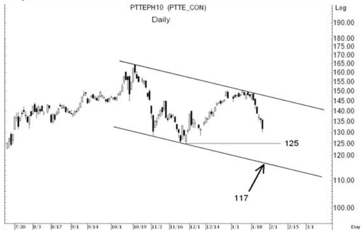
Figure 5: PTTEPH10 Futures