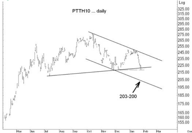
Figure 4: PTTH10 Futures