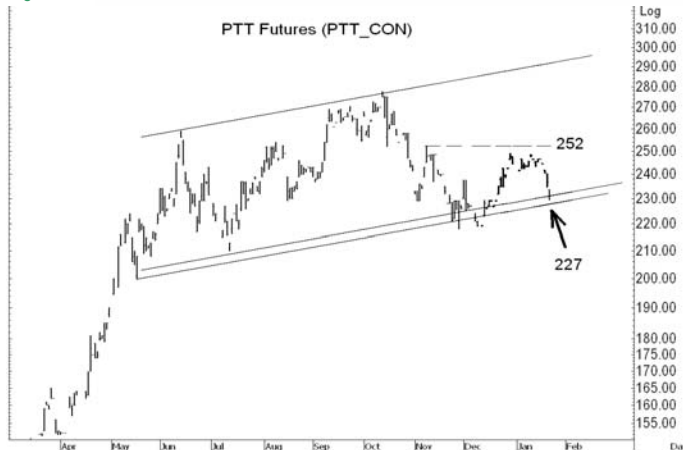
Figure 4: PTT10 Futures