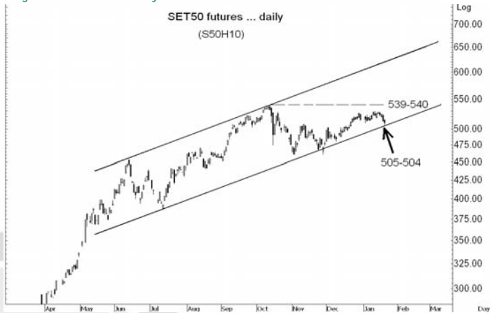
Figure 3: SET50 Futures Premium