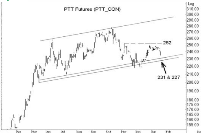
Figure 4: PTTTH10 Futures