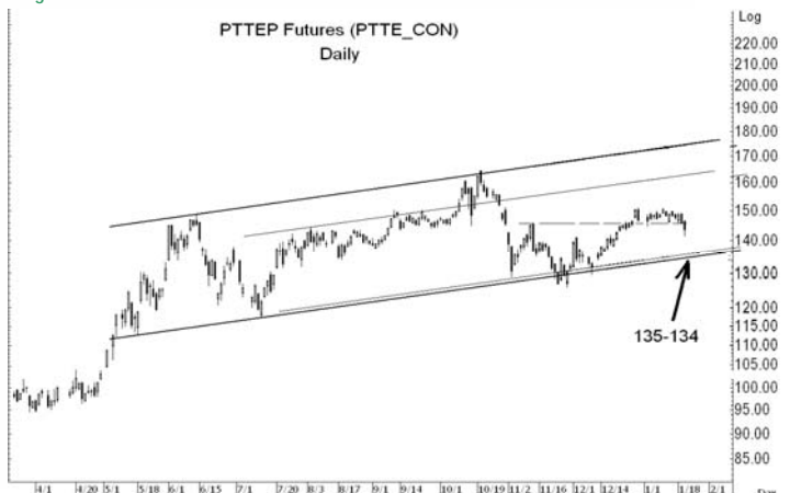
Figure 5: PTTEPH10 Futures