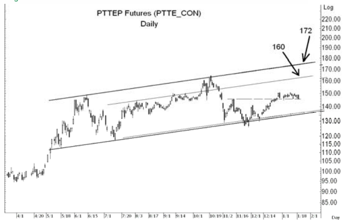
Figure 5: PTTEP10 Futures