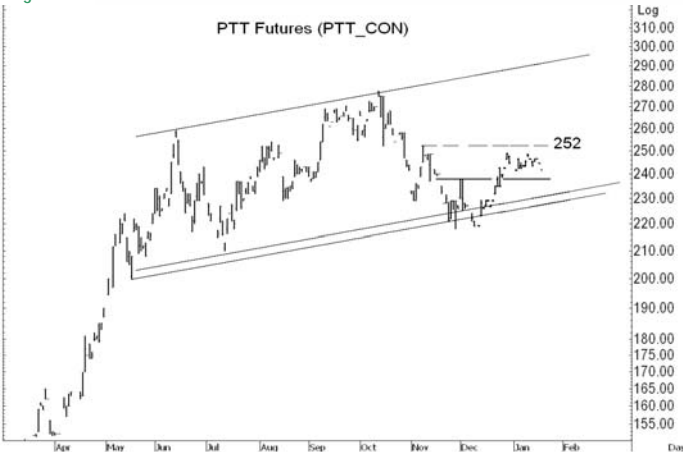
Figure 4: PTT10 Futures