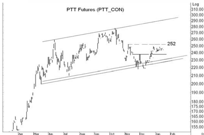
Figure 4: PTTH10 Futures