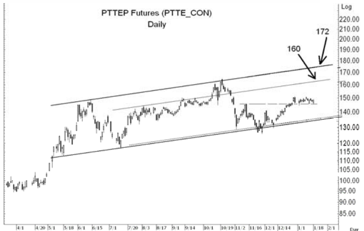
Figure 5: PTTEPH10 Futures