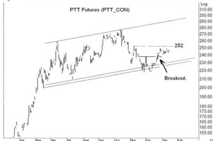
Figure 4: PTTH10 Futures