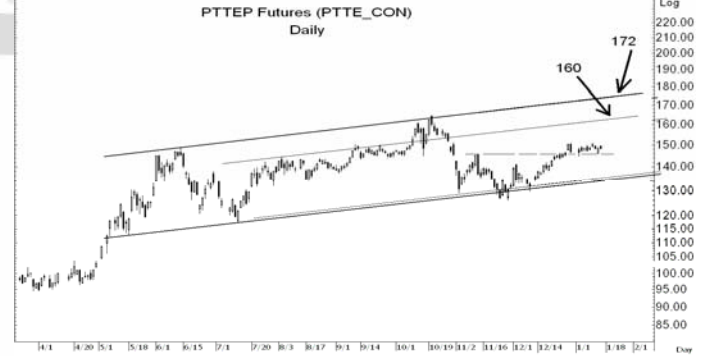
Figure 5: PTTEP10 Futures