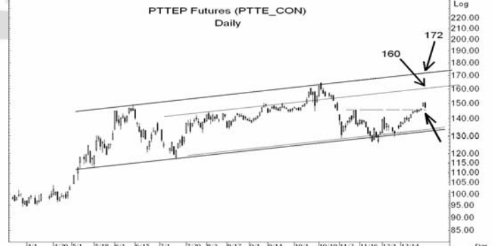
Figure 5: PTTEP10 Futures