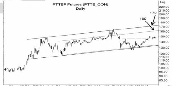
Figure 5: PTTEP10 Futures