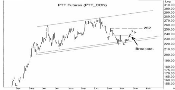
Figure 4: PTT10 Futures