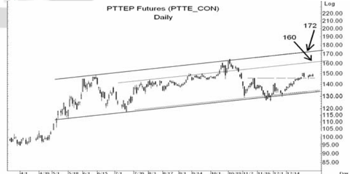
Figure 5: PTTEP10 Futures