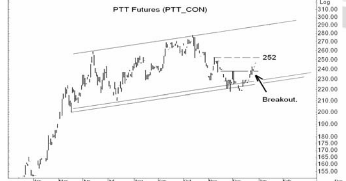
Figure 4: PTT10 Futures