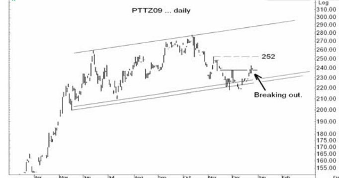
Figure 4: PTTZ09 Futures