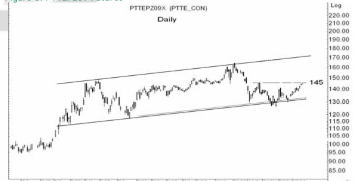
Figure 5: PTTEPZ09 Futures