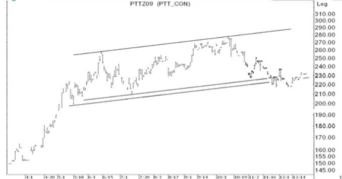
Figure 4: PTTZ09 Futures