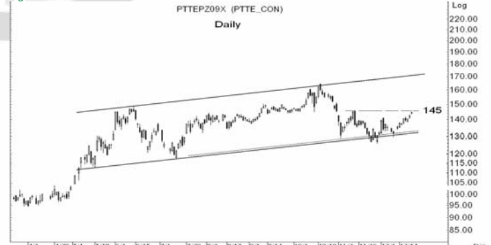
Figure 5: PTTEPZ09 Futures