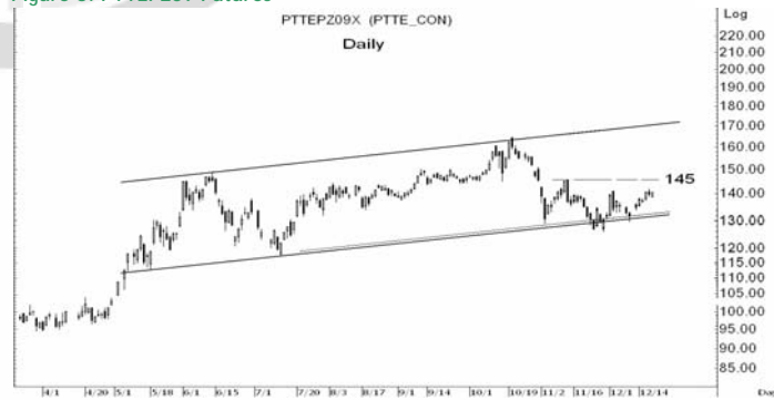
Figure 5: PTTEPZ09 Futures