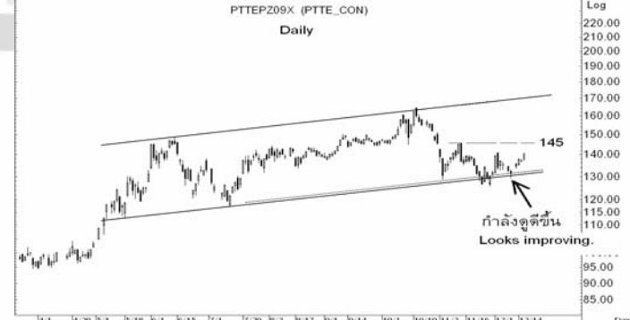
Figure 5: PTTEPZ09 Futures