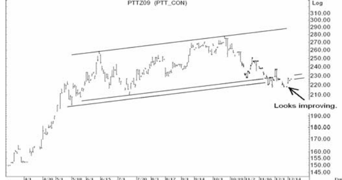
Figure 4: PTTZ09 Futures