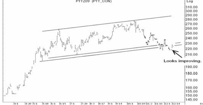
Figure 4: PTTZ09 Futures