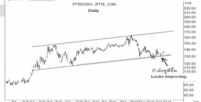
Figure 5: PTTEPZ09 Futures