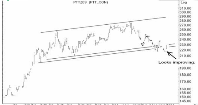
Figure 4: PTTZ09 Futures