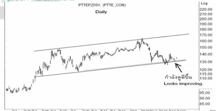
Figure 5: PTTEPZ09 Futures