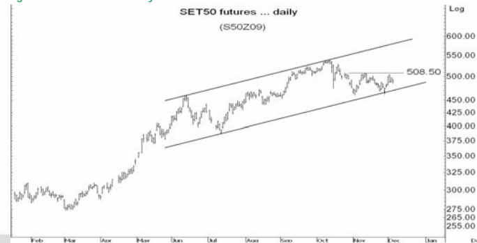
Figure 3: SET50 Futures Premium