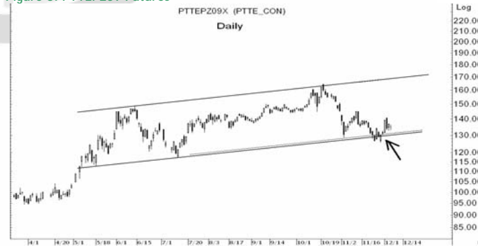
Figure 5: PTTEPZ09 Futures