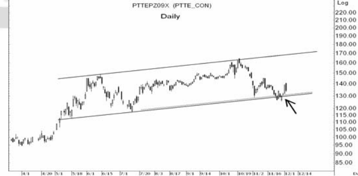
Figure 5: PTTEPZ09 Futures