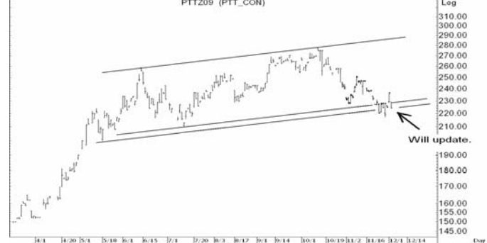
Figure 4: PTTZ09 Futures