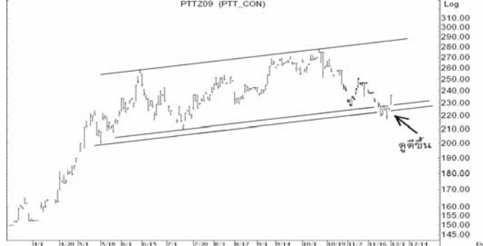
Figure 4: PTTZ09 Futures