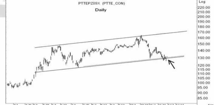
Figure 5: PTTEPZ09 Futures