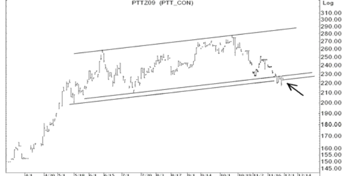
Figure 4: PTTZ09 Futures