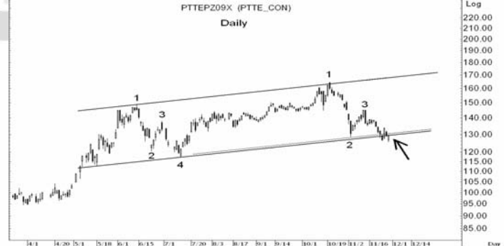
Figure 5: PTTEPZ09 Futures