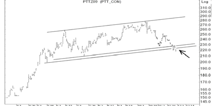
Figure 4: PTTZ09 Futures