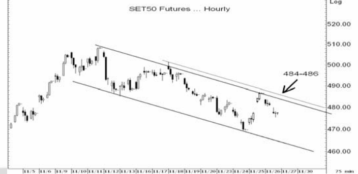
Figure 3: SET50 Futures Premium