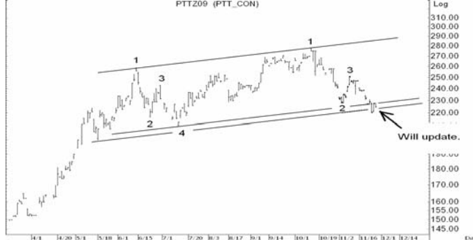
Figure 4: PTTZ09 Futures