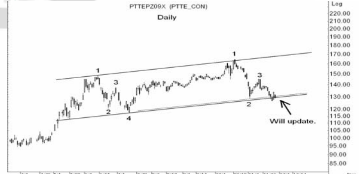
Figure 5: PTTEPZ09 Futures