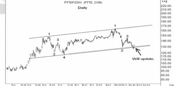
Figure 5: PTTEPZ09 Futures