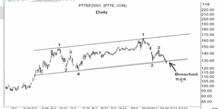
Figure 5: PTTEPZ09 Futures