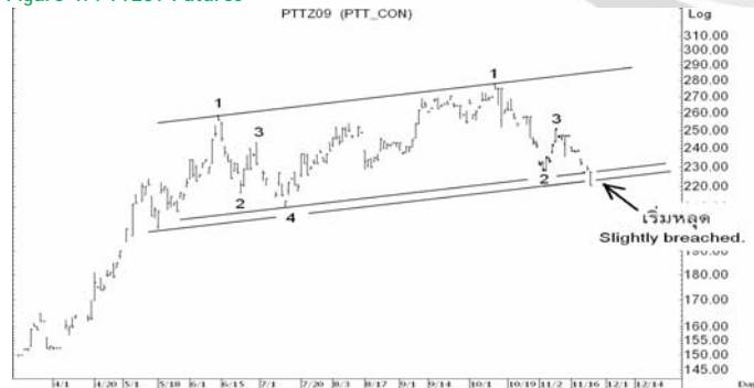
Figure 4: PTTZ09 Futures