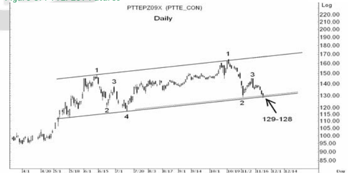
Figure 5: PTTEPZ09 Futures