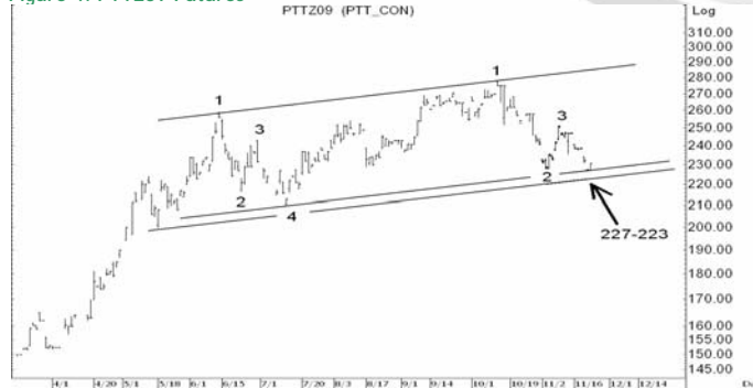
Figure 4: PTTZ09 Futures