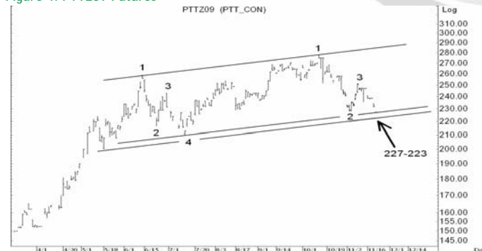
Figure 4: PTTZ09 Futures