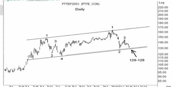
Figure 5: PTTEPZ09 Futures