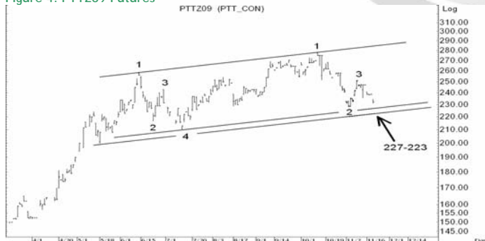
Figure 4: PTTZ09 Futures