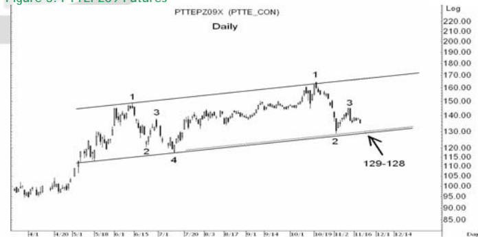
Figure 5: PTTEPZ09 Futures