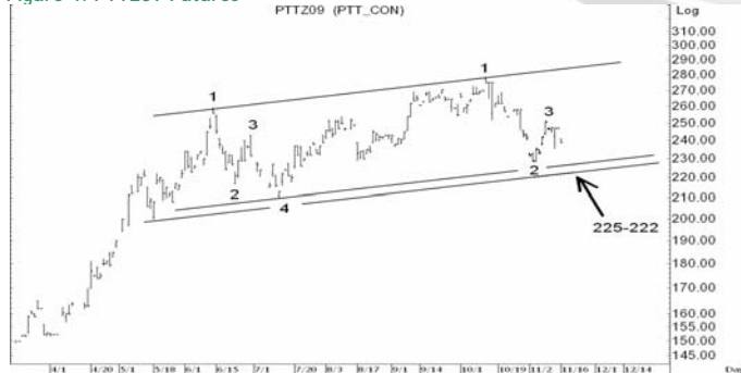
Figure 4: PTTZ09 Futures