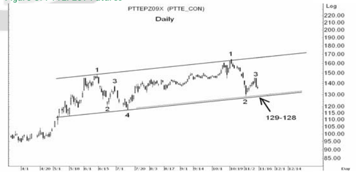
Figure 5: PTTEPZ09 Futures