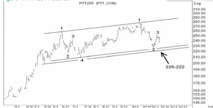
Figure 4: PTTZ09 Futures