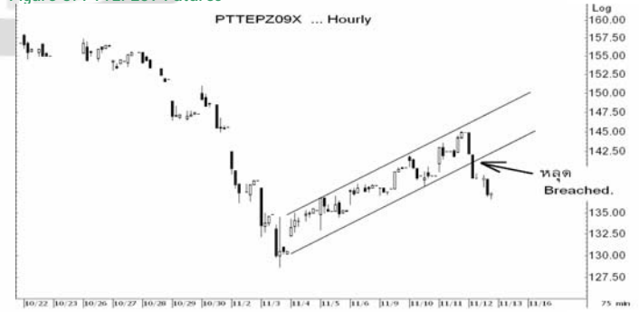
Figure 5: PTTEPZ09 Futures