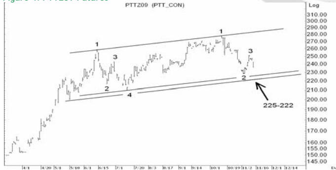
Figure 4: PTTZ09 Futures