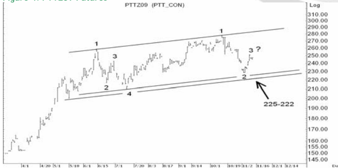
Figure 4: PTTZ09 Futures