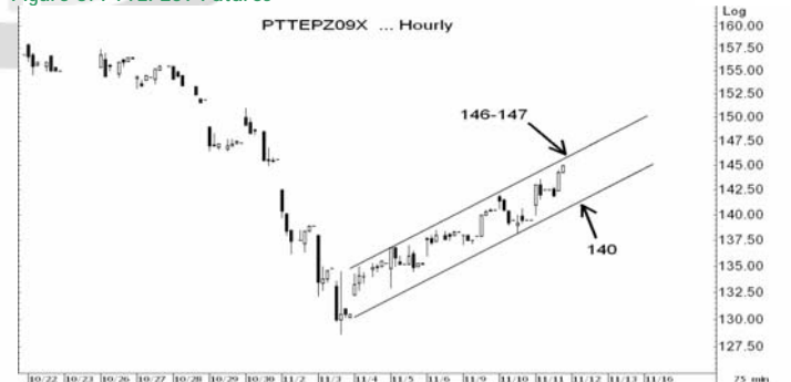
Figure 5: PTTEPZ09 Futures