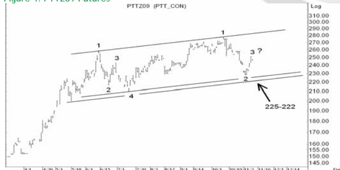
Figure 4: PTTZ09 Futures