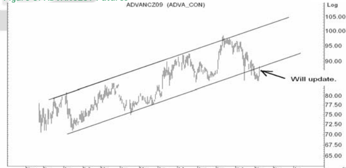
Figure 5: ADVANC209 Futures