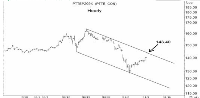
Figure 4: PTTEP209 Futures