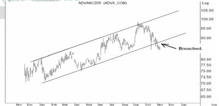
Figure 5: ADVANCZ09 Futures