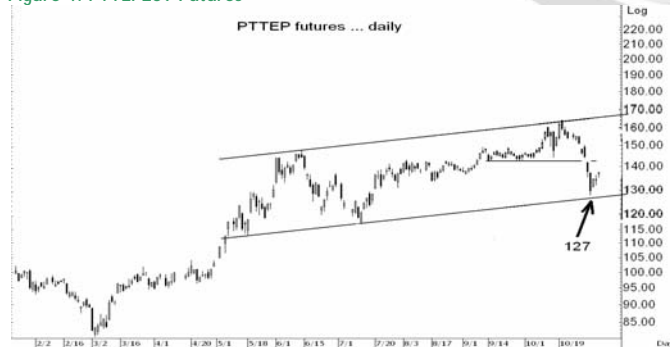
Figure 4: PTTEPZ09 Futures