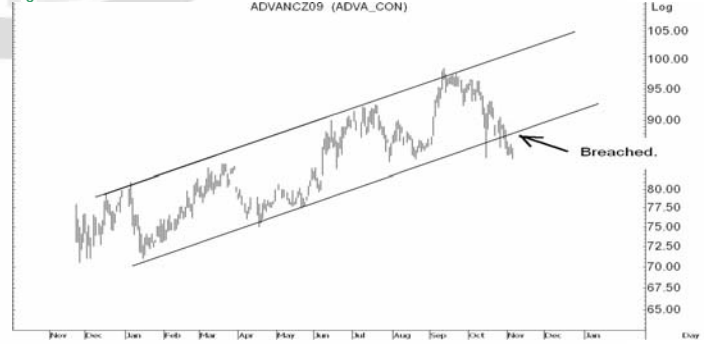
Figure 5: ADVANCZ09 Futures