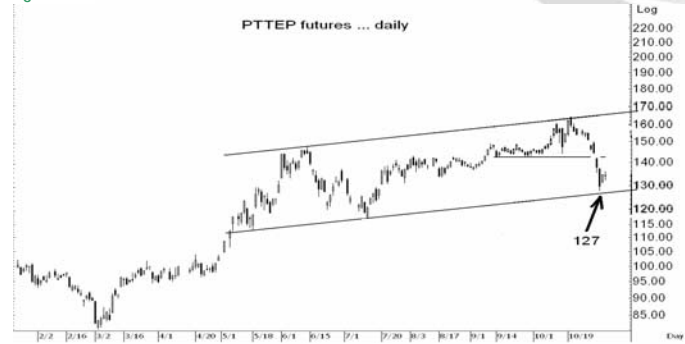
Figure 4: PTTEPZ09 Futures