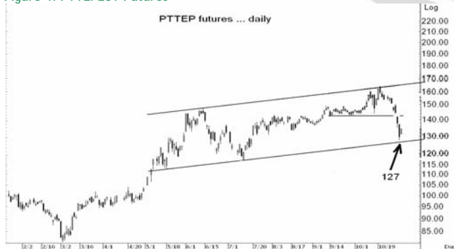
Figure 4: PTTEPZ09 Futures