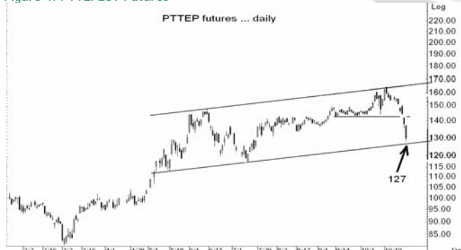
Figure 4: PTTEPZ09 Futures