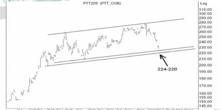
Figure 5: PTTZ09 Futures