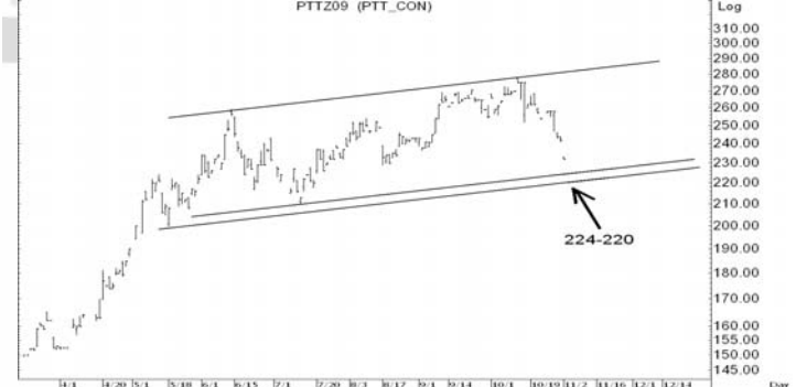
Figure 5: PTTZ09 Futures