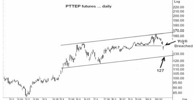
Figure 4: PTTEPZ09 Futures