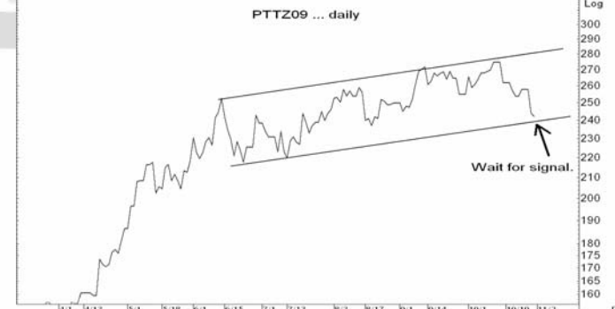
Figure 5: PTTZ09 Futures