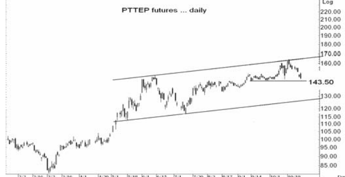
Figure 4: PTTEPZ09 Futures