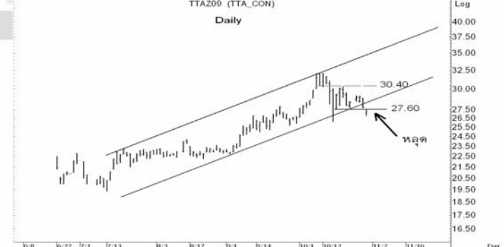
Figure 5: TTAZ09 Futures