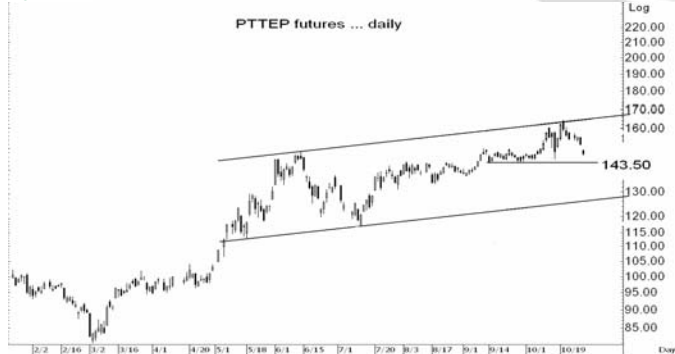
Figure 4: PTTEP09 Futures