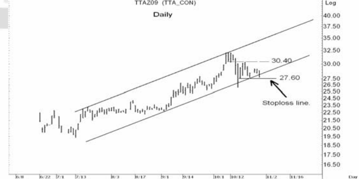
Figure 5: TTAZ09 Futures