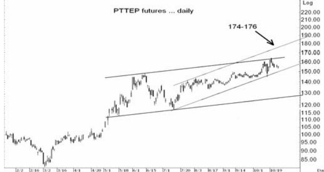
Figure 4: PTTEPZ09 Futures