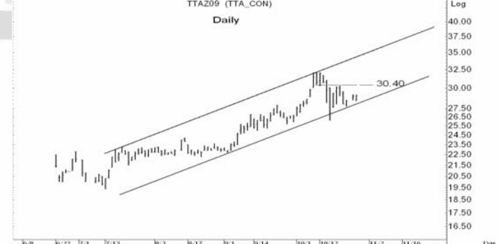
Figure 5: TTAZ09 Futures