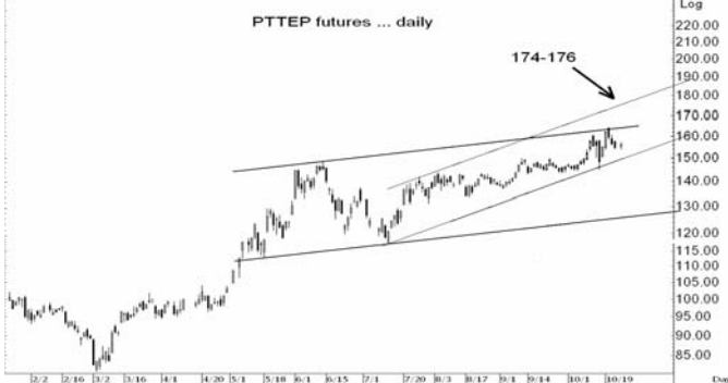
Figure 4: PTTEP209 Futures