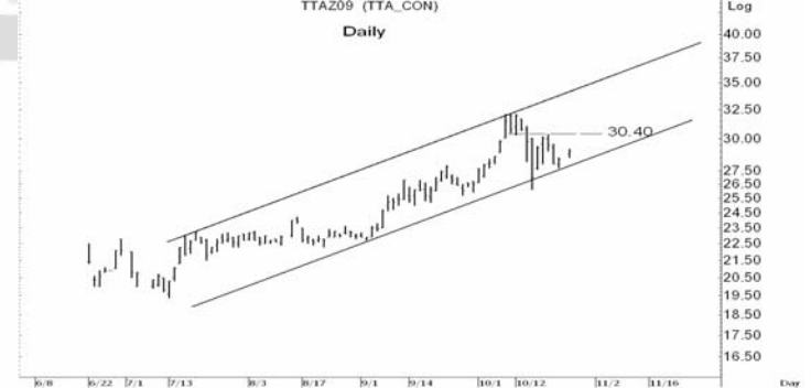
Figure 5: TTAZ09 Futures