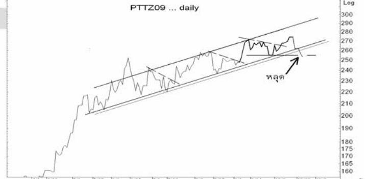
Figure 5: PTTZ09 Futures