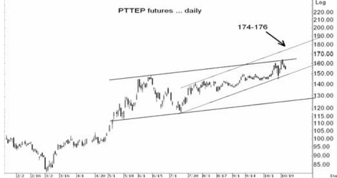
Figure 4: PTTEP209 Futures