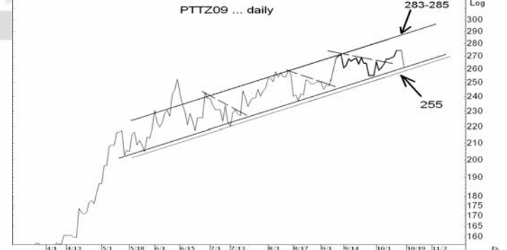
Figure 5: PTTZ09 Futures