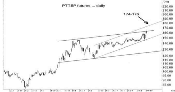
Figure 4: PTTEPZ09 Futures