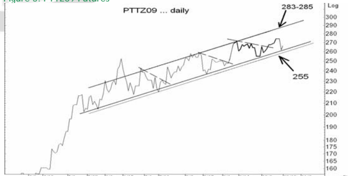
Figure 5: PTTZ09 Futures