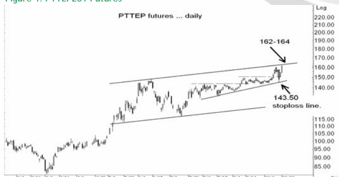
Figure 4: PTTEPZ09 Futures